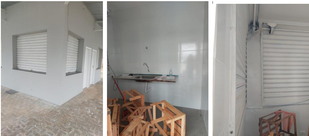
Quiosque 2: Entrando pela Rua dos Gomes o segundo quiosque.